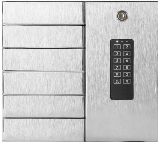
Netkeybox 3006 B

Einfache Programmierung über die Tastatur