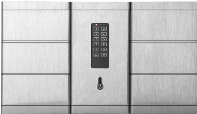
Netkeybox 4006 B Best.Nr.: 30002