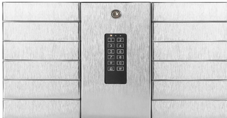
Netkeybox 3012 B Best.Nr.: 40004

Aufpreis V 4 A für 6 Fächer Aufpreis V 4 A für 12 Fächer