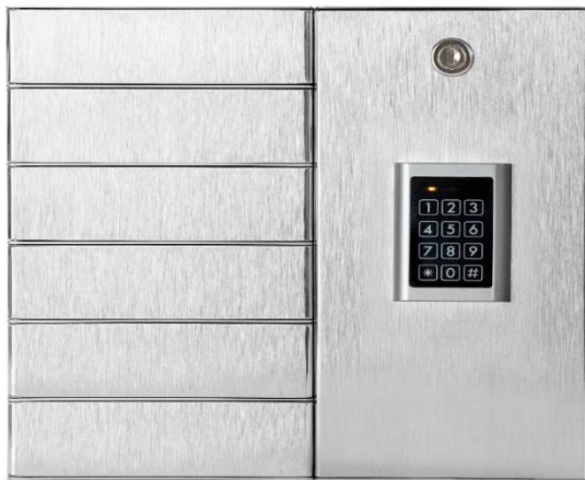
Netkeybox 3006 A