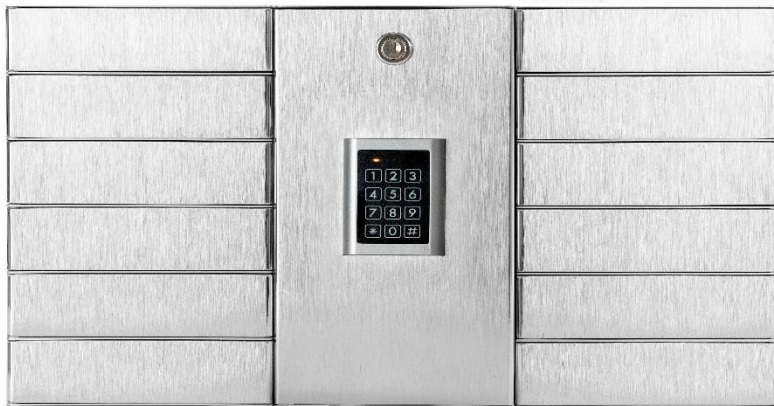
Netkeybox 3012 A

Aufpreis V 4 A für 6 Fächer Aufpreis V4 A für 12 Fächer